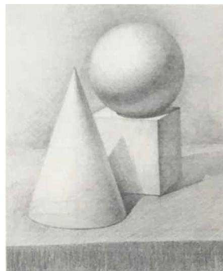
Рисунок 1 - Примеры возможных натюрмортов